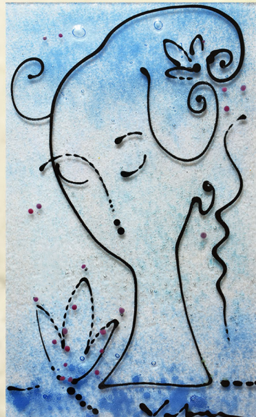
Jezero lotosa , 2019., fuzija stakla, 40 x 25 cm