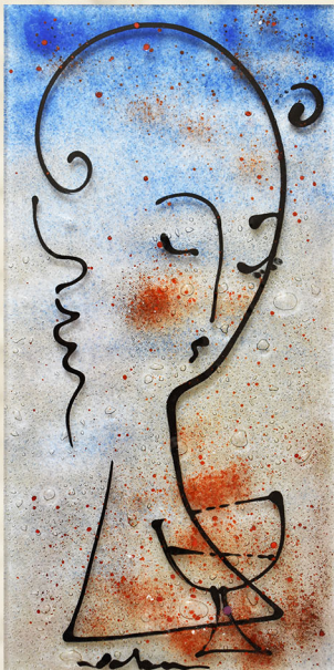
Sanjiva , 2019., fuzija stakla, 40 x 20 cm