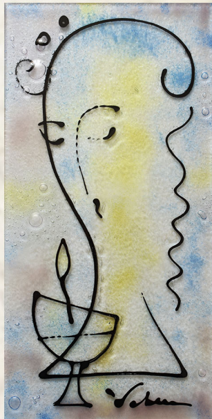
Moj cvijet , 2019., fuzija stakla, 40 x 20 cm